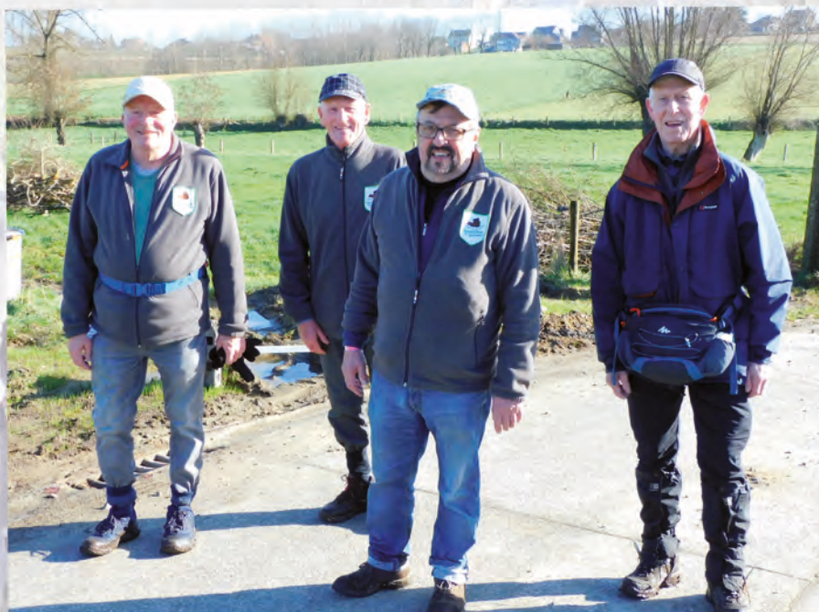
De heldhaftige wandelaars (die ook op de cover van dit blad in actie te zien zijn) op de krakelingentocht te Bever op 23/02/22

Alles te verkrijgen op onze eigen wandelingen